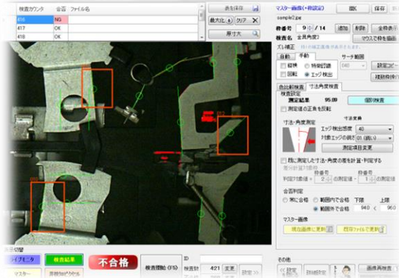
部品の寸法と角度