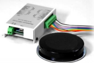
I/O ユニットとフットスイッチ

お問い合わせはお気軽に info@skylogiq.co.jp (053) 414-6209